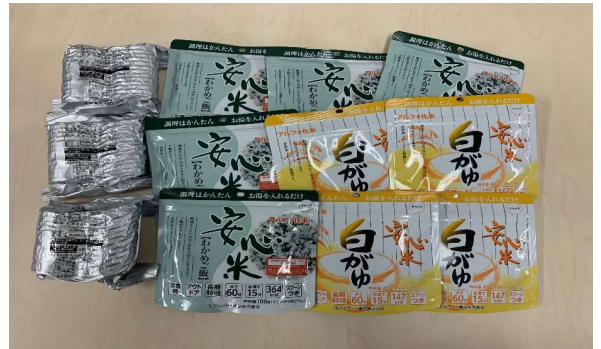
※1人分の目安です (種類は選べません)